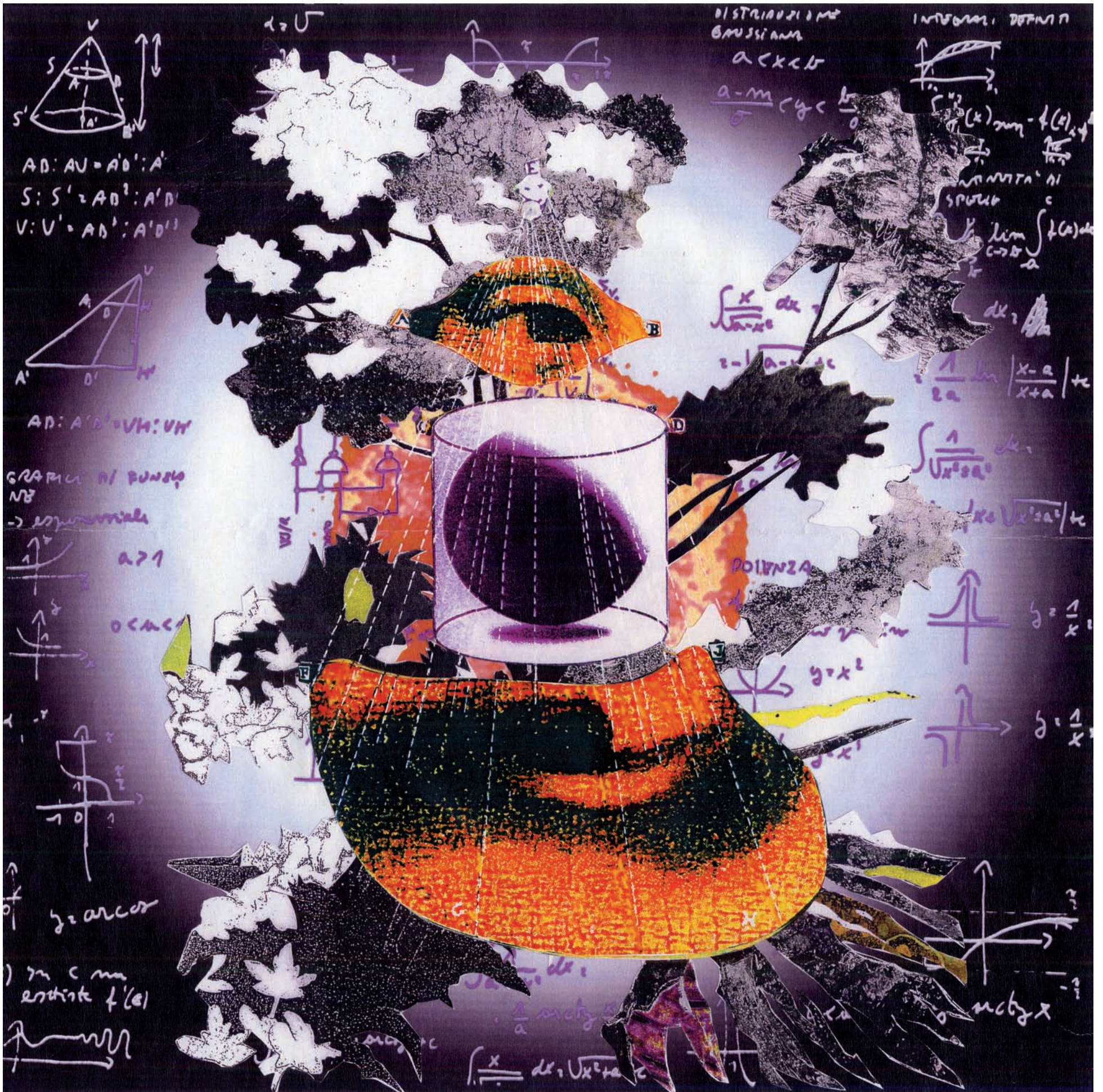
Figura tratta da un manoscritto di Leonardo da Vinci, come descritto da Giulio Parigi, "L'arte della prospettiva cilindrica", 1642. Rielaborazione grafica di Marcello e Michele Salucci dal titolo: "La Dominazione 3"