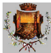
Comune di Cesenatico