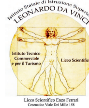
Liceo Scientifico Enzo Ferrari Cesena - Viale Dei Mille 158